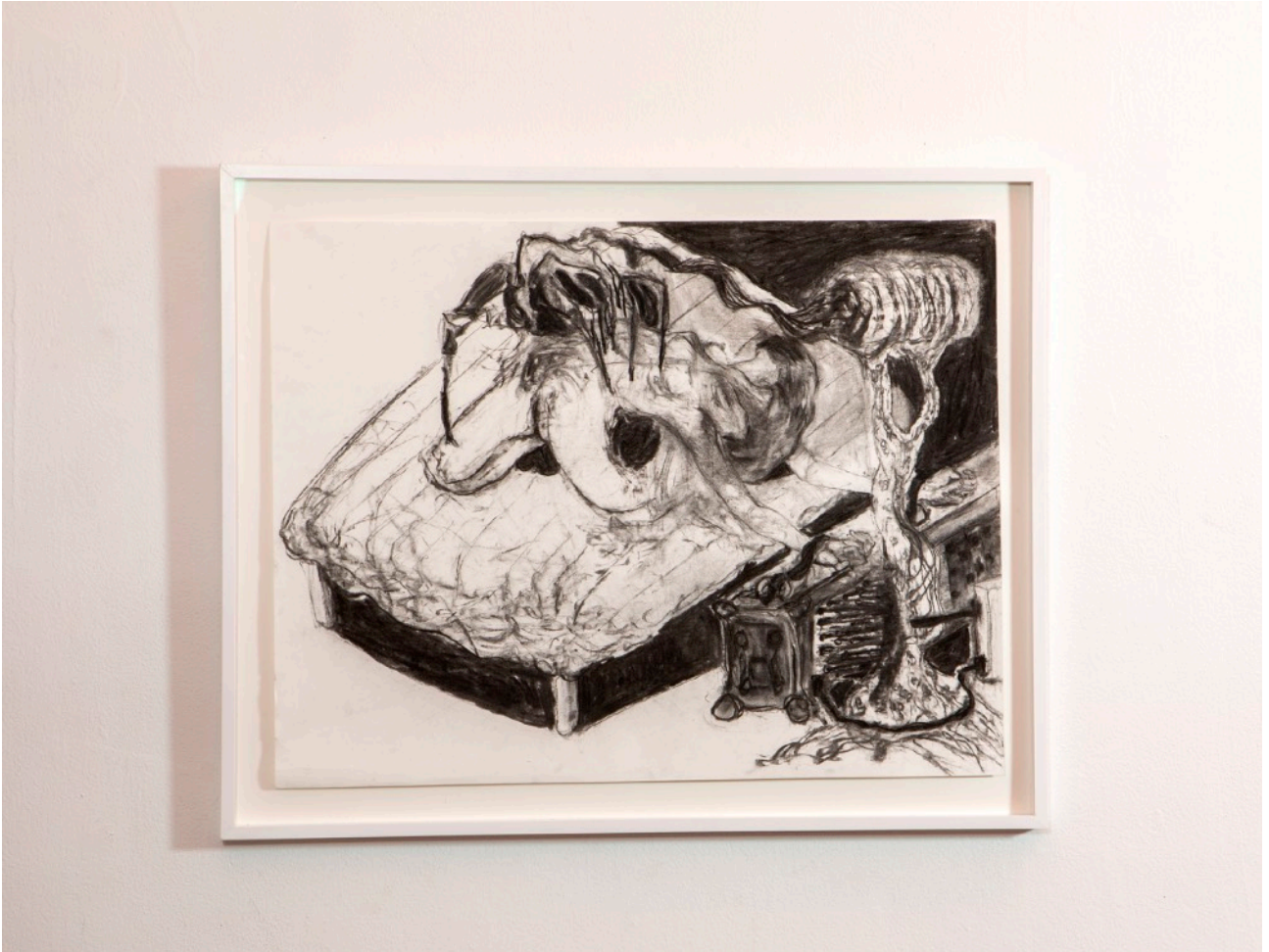
ANATOMICAL, 2024. Kol på papper. 49 x 65 cm,